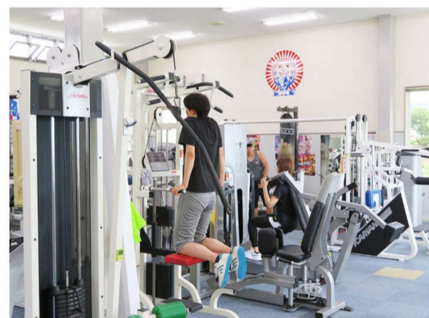
フリーウェイトをはじめ各種マシンなどの設備が揃うフロア