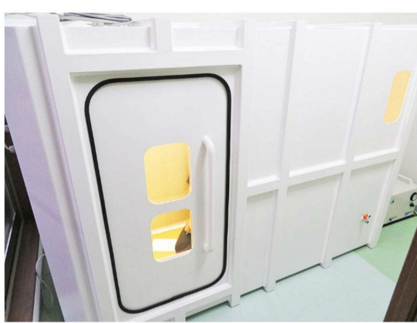
納品された酸素キャビン、多くのお客様の利用が見込まれます